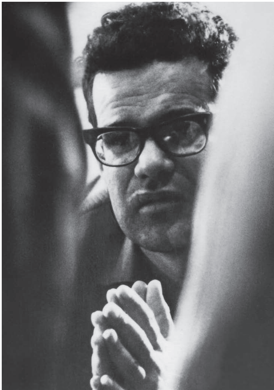
KONRAD WOLF – DEUTSCHLAND UND EUROPA Retrospektive | Internationales Symposium | Ausstellung